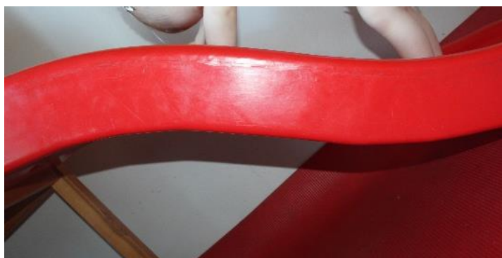
Hvordan bruke kinestetiske sansen (muskel-leddsans)?

Gjennom aktivt bruk av kropp og muskler for barna erfaringer de tar med seg videre. Det betyr at de etter hvert vet nøyaktig hvilke muskler som skal brukes når de f.eks skal kaste en ball, gå i en trapp og klatre. (Småbarns kroppslige verden, 2006 s 34)