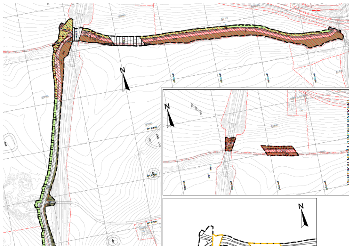
Figur 2. Utsnitt fra plankart, datert 01.02.2019