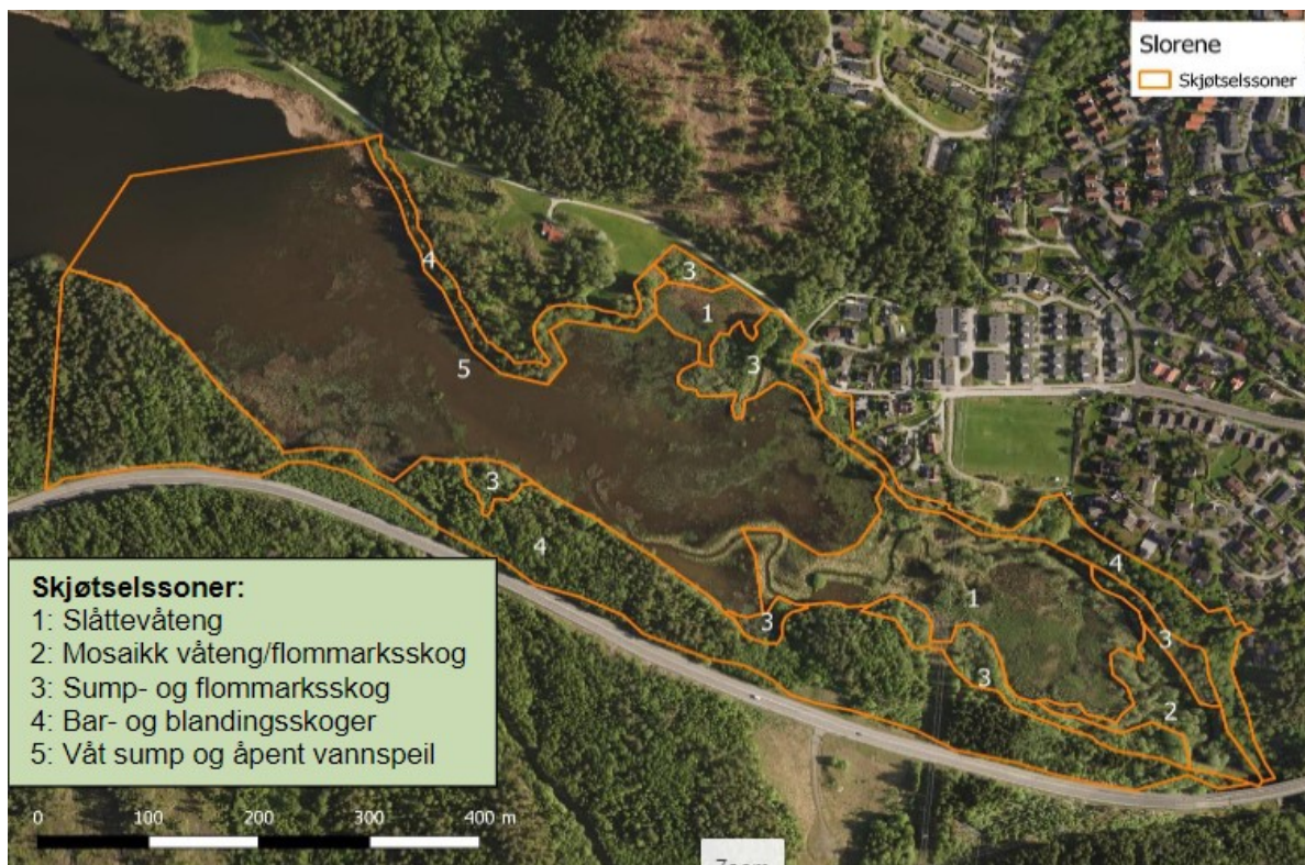
Figur 1: Oversikt over skjøtselssoner innenfor Slørene naturvernområde.

viser hvilke tiltak som skal utføres innenfor de ulike sonene, hvem som har ansvaret, når gjennomføringen skal skje og kostnader. Planen skal revideres hvert tiende år eller ved behov.