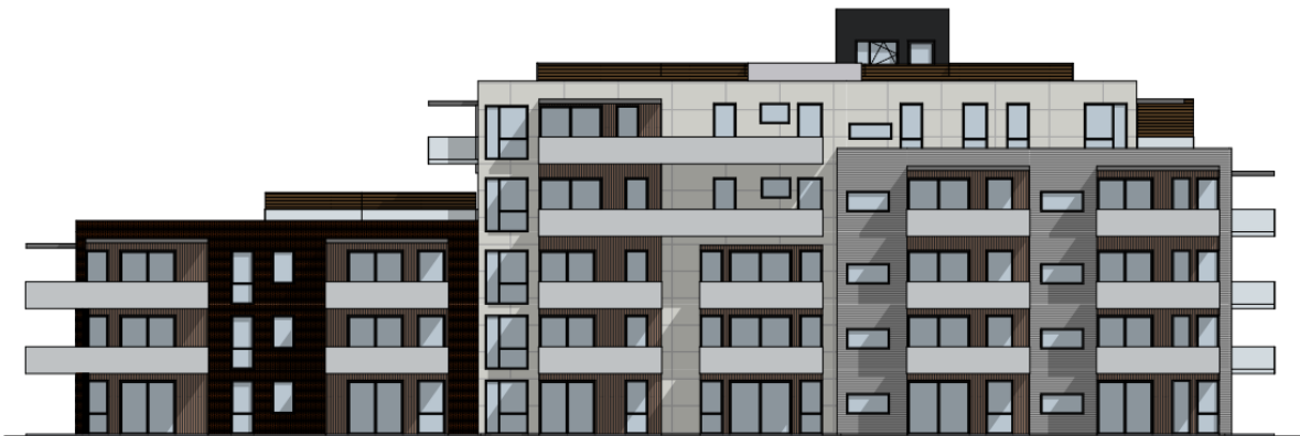
FASADE MOT SYDVEST

Bygg C er et lamellbygg som søkes oppført med 33 boenheter med en variasjon fra to-roms til fireroms-leiligheter. Flere leiligheter har mulighet for egen hybel. Blokken søkes oppført med felles takterrasse på deler av taket. Leilighetene har belysning både gjennomgående, ensidig og flersidig.