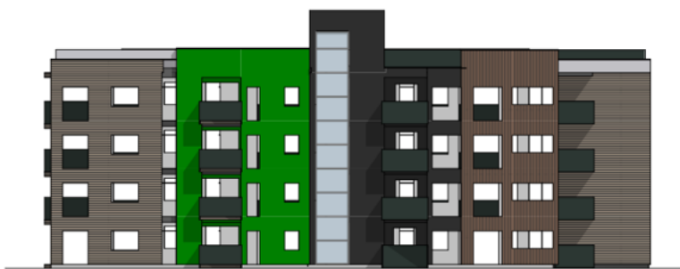
FASADE MOT BREKKEVEIEN I SYDØST

Blokk B er en lamellbygning som søkes oppført med 32 leiligheter med en variasjon fra to-roms til fireroms-leiligheter med variert størrelse fra 33 m 2 til 80m 2 . Blokken søkes oppført med felles takterrasse. Leilighetene har variasjon i størrelse med verandaer som varierer i størrelse fra 8,3 m 2 til 27,8 m 2 . De fleste har en egen bod i egen leilighet.