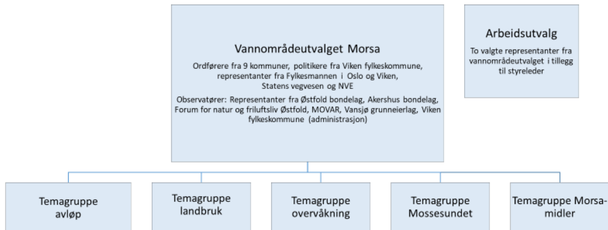
Figur 1 – Skisse over vannområdets organisering i ulike grupper

Vannområdets arbeid er organisert i syv ulike grupper (figur 1). Vannområdeutvalget Morsa (styringsgruppe) legger rammene for arbeidet til daglig leder og temagruppene.