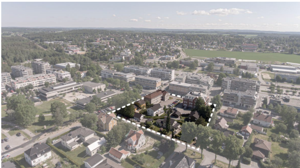
Figur 2. Planområdet sett fra sørvest.

Planområdet utgjør et areal på ca 6,7 daa og er ett av de mest sentrale områdene i Ås sentrum, med Ås rådhus som nærmeste nabo i nord, og om lag 100 meter avstand til Ås stasjon. Planområdet består i dag av tre eneboliger, to kontor- og forretningsbygg og dagsenteret i Skoleveien 4, som eies og driftes av Ås kommune. Planområdet har også store flater som brukes til parkering.