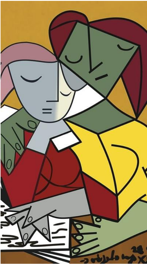
Bilde 1 Picasso

Med prosjekterende arbeidsmåter erfarer vi at avdelingen har en utforskende arbeidsmetode for både barn og ansatte. For oss på Mars så betyr arbeidsmåten en holdning til at alt vi gjør er utforskende , vi jobber ikke prosjektøker med oppsatte tider på ukeplanen.