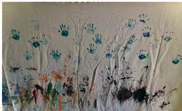
Bildet: Luna avdeling

Våren har ankommet våre nærområder. Barna leker mere ute i det stadig varmere været. I tillegg kan barna ha på mye mindre lag med klær, og kroppen får muligheten til friere bevegelser. Det som har skjult seg lenge under snøen kan barna oppdaget nå.