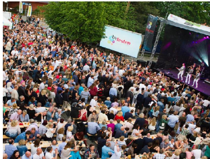
Foto: Lillestrøm kultursenter, Byfesten 2017.

Byfesten i Lillestrøm har mange åpne arrangementer med fri entre. Her festen i 2017, lørdagens arrangementer foran Kultursenteret. Hele dagen var scenen fylt med lokale utøvere, band, kor og orkestre. Publikum storkoste seg i vårsola.