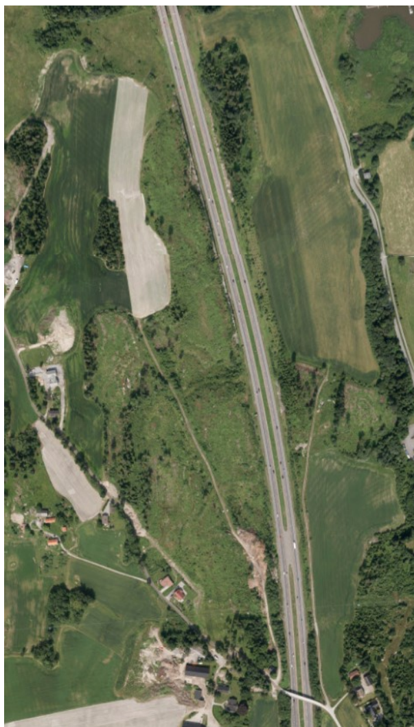
Ortofoto av planområdet